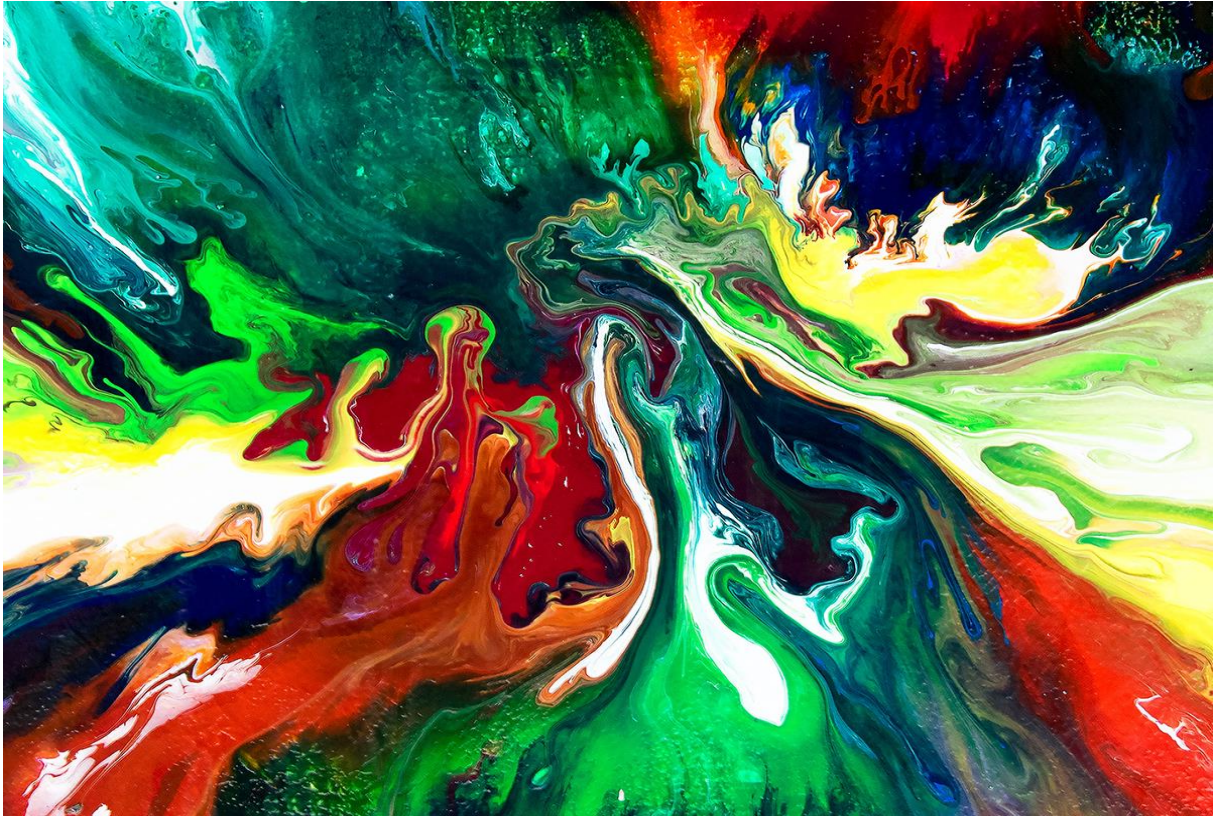
Obraz do pokazania na tablicy interaktywnej