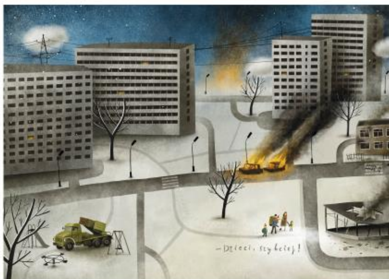
Ilustracja: Maciej Szymanowicz, [w:] Barbara Gawryluk, Teraz tu jest nasz dom , Wydawnictwo Literatura, Łódź 2016, s. 16-17 .