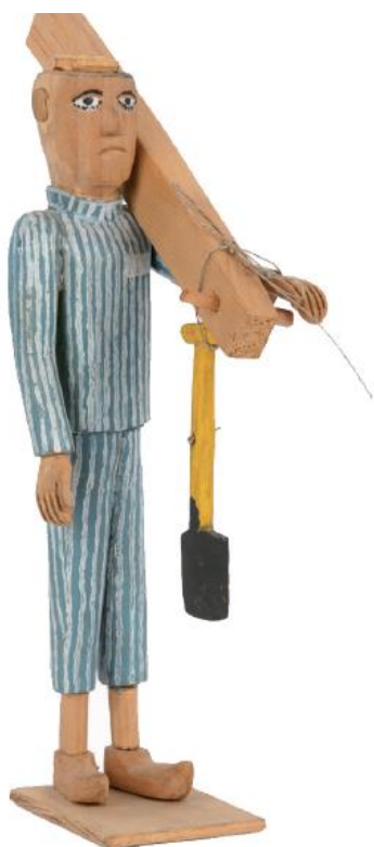
Więzień z belką na ramieniu