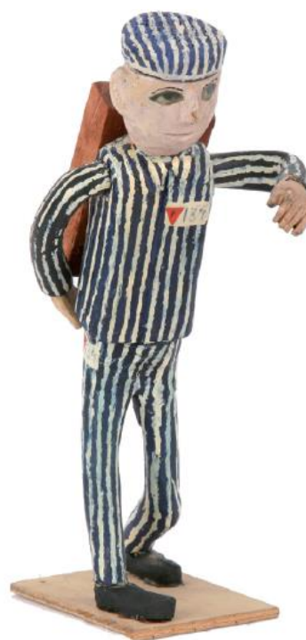
Więzień nr 134