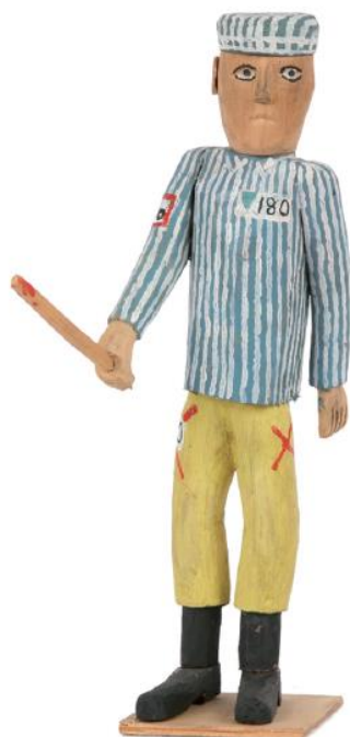
Kapo nr 180 z pałką